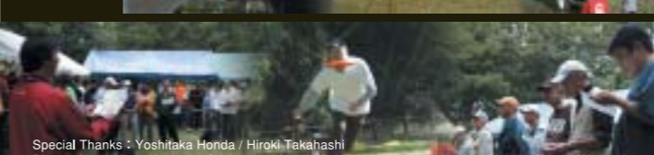
Special Thanks : Yoshitaka Honda / Hiroki Takahashi